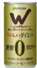
「W おいしいダイエット 糖類・カロリー0」190g缶

株式会社伊藤園は、コーヒーブランド「W」で高級なコーヒー豆であるマンデリンを主体に使用し、無糖、ノンカロリーの「W おいしいダイエット 糖類・カロリー0」を8月25日に発売する。6月の発売した「W おいしいダイエット糖類 80%カット」に続くシリーズ第2段商品。「W」ブランドは、「おいしさ」と「高ポリフェノール」が特徴の缶コーヒー。クロロゲン酸(コーヒーに含まれるポリフェノール)を同社基準値比で2倍に相当する50mg含んでいる。190g入り120円で販売される。 (2008年8月21日 株式会社 伊藤園 プレスリリース)