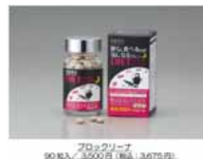
ブロックリーナ 90粒入、3,500円(税別)3,675円